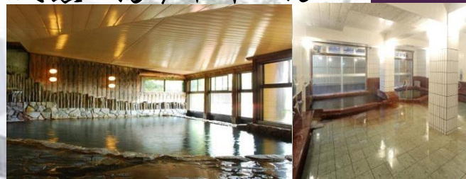
貸切露天風呂月待の湯